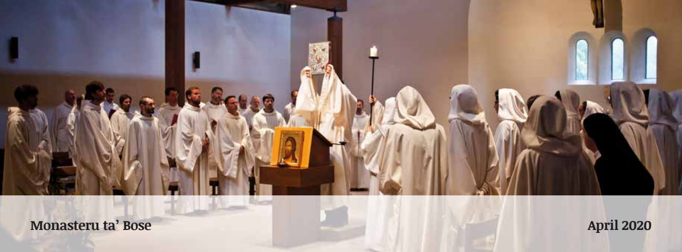
Monasteru ta' Bose