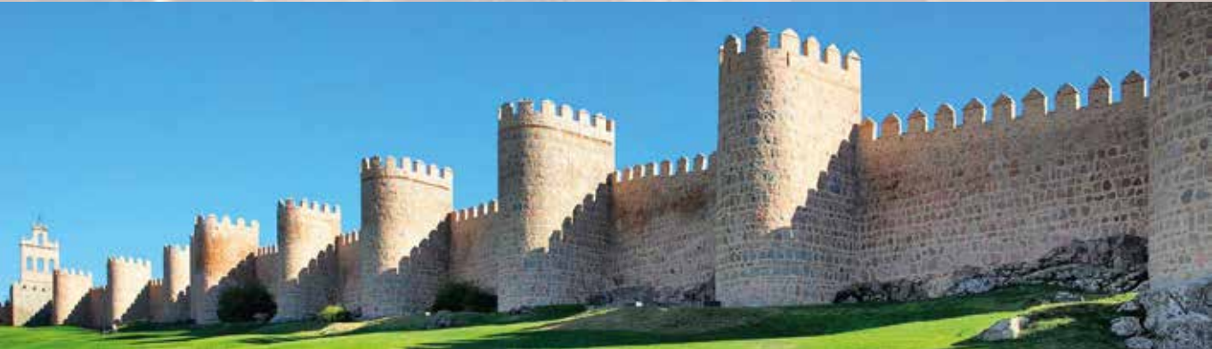
Pellegrinaġġ fuq il-passi tal-Mistiċi Spanjoli